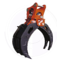
Захват для брёвен